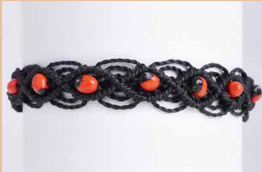
42985 Armband Huayruro, schwarz