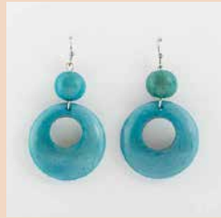
48461 Ohrr. Tagua Dora, türkis