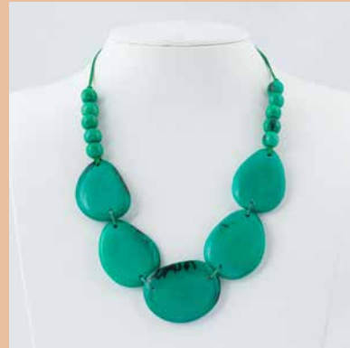
41244 Kette Tagua Dona, türkis