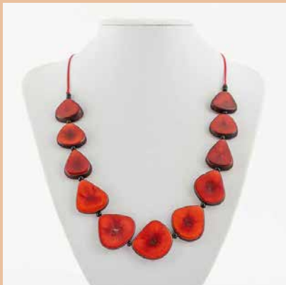
41312 Kette Tagua-Herz, rot