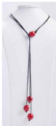
41352 Kette Bombona lang, rot