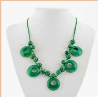
48452 Kette Tagua-Dora, grün

Modell Kette Tagua Dora Material Tagua Nuss