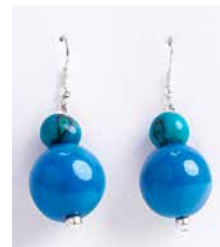
41336 Ohrh. Bombona, türkis