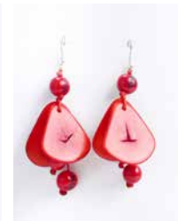
41345 Ohrh. Tagua Chips, rot