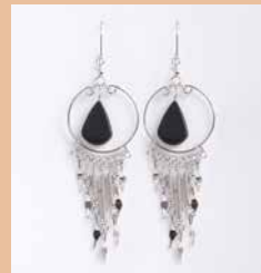
43002 Ohr. Carmen, Onyx