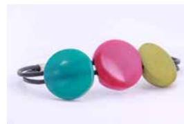
43134 Armband Tagua / 3 Kreise, sortiert