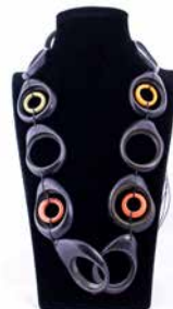
41315 Kette Tagua Olga, d.grün