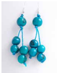
41338 Ohrh. Acai, türkis