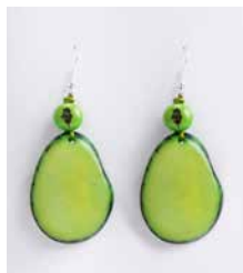
41348 Ohrh. Tagua/Acai, lemon