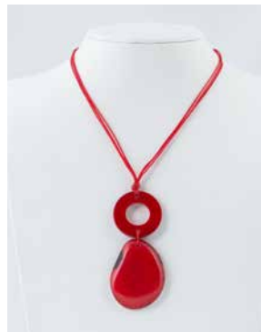
41278 Kette Tagua 1 Kreis/1 Tropfen, rot