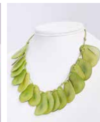
41321 Kette Tagua Chips, lemon