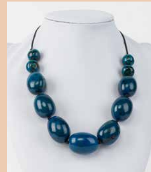
41237 Kette Aguaje, petrol