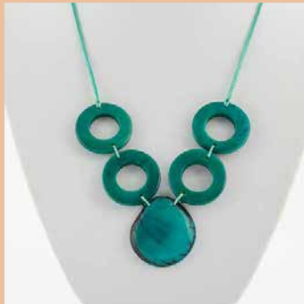
41287 Kette Tagua 4 Kreise/1 Tropfen, türkis