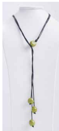
41353 Kette Bombona lang, lemon