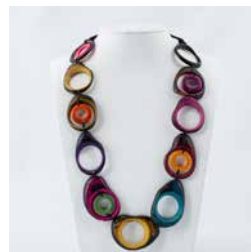
41289 Kette Tagua Olga, multicolor