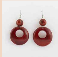
48462 Ohrr. Tagua Dora, rot