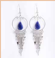
42999 Ohr. Carmen, Sodalith