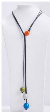
41351 Kette Bombona lang, multicolor