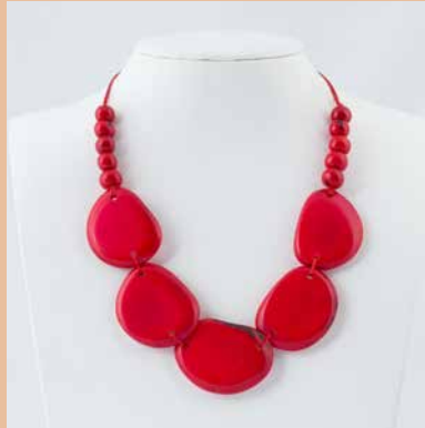
41240 Kette Tagua Dona, rot