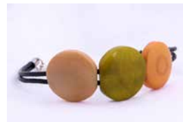
43134 Armband Tagua / 3 Kreise, sortiert