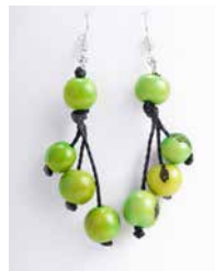
41358 Ohrh. Acai, 3-stufig, lemon