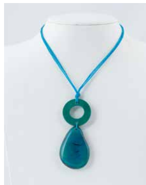
41281 Kette Tagua 1 Kreis/1 Tropfen, türkis