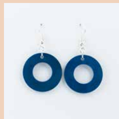
41270 Ohrring Tagua Kreis, blau