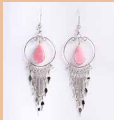
43000 Ohr. Carmen, Rosenquarz