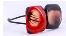
43133 Armband Tagua / 2 Quadrate, sortiert