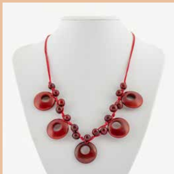
48456 Kette Tagua-Dora, rot