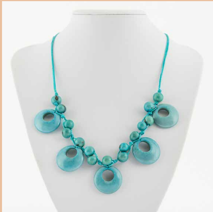
48455 Kette Tagua-Dora, türkis