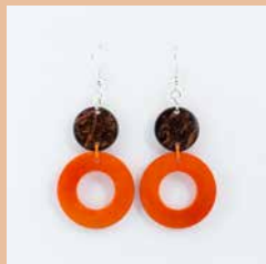
41273 Ohrring Tagua/Kokos Kreis, orange