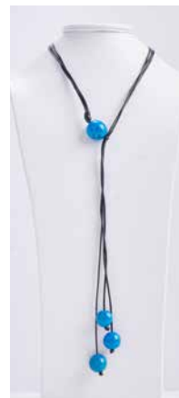
41355 Kette Bombona lang, türkis