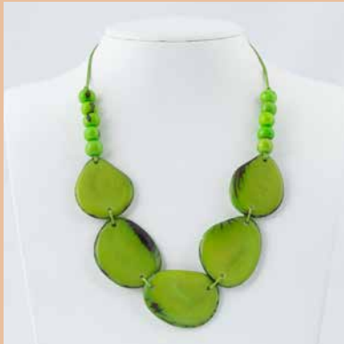
41242 Kette Tagua Dona, lemon