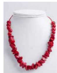
41328 Kette Tagua Kies,, rot