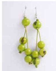
41339 Ohrh. Acai, lemon