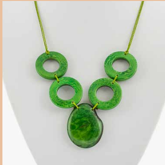
41286 Kette Tagua 4 Kreise/1 Tropfen, lemon