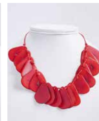
41323 Kette Tagua Chips, rot