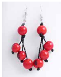
41360 Ohrh. Acai, 3-stufig, rot