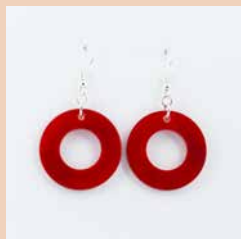
41266 Ohrring Tagua Kreis, rot