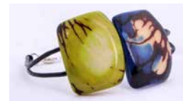
43133 Armband Tagua / 2 Quadrate, sortiert