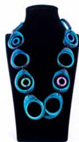
41316 Kette Tagua Olga, petrol/bl. T