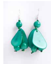
41344 Ohrh. Tagua Chips, s.-grün