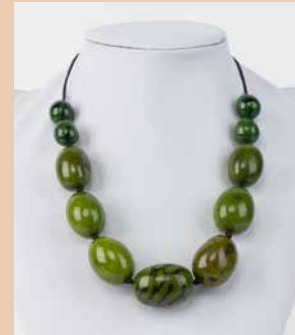
41233 Kette Aguaje, oliv- grün