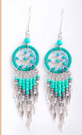
42988 Ohrh. Traumfänger, türkis