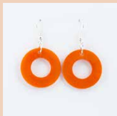
41267 Ohrring Tagua Kreis, orange