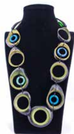
41317 Kette Tagua Olga, olive/bl. T