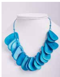
41320 Kette Tagua Chips, türkis