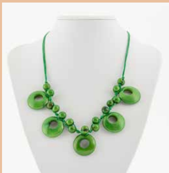
48454 Kette Tagua-Dora, lemon