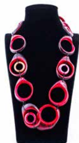
41314 Kette Tagua Olga, rot/orange