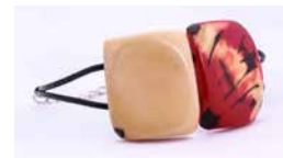
43133 Armband Tagua / 2 Quadrate, sortiert