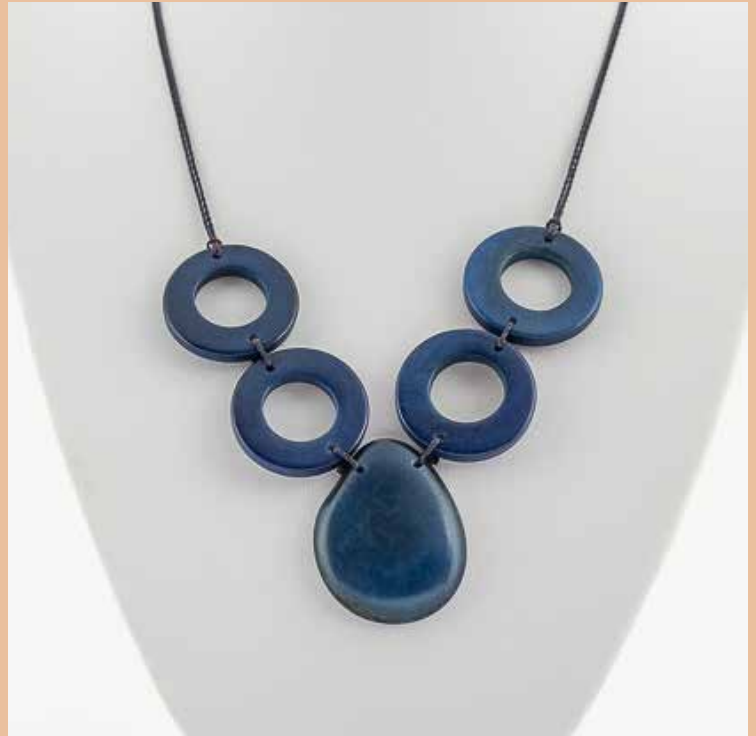
41288 Kette Tagua 4 Kreise/1 Tropfen, blau