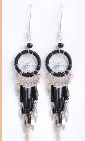
42990 Ohrh. Traumfänger, schwarz