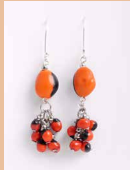
42981 Ohrh. Huayruro

Seit den Zeiten der Inka werden diese Samen aus dem Amazonas als Amulett getragen.