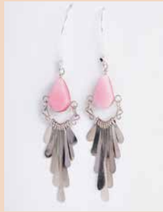
42994 Ohr. Kolibri, Rosenquarz