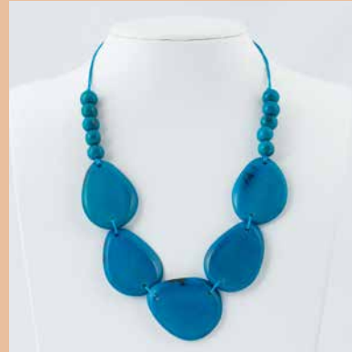
41241 Kette Tagua Dona, petrol