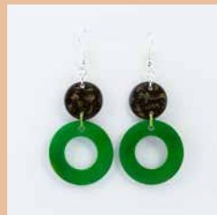
41274 Ohrring Tagua/Kokos Kreis, lemon-grün