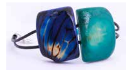
43133 Armband Tagua / 2 Quadrate, sortiert