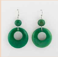
48458 Ohrr. Tagua Dora, grün