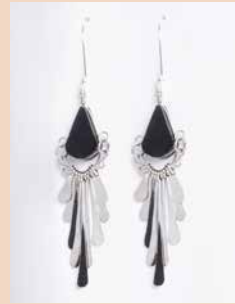
42996 Ohr. Kolibri, Onyx