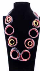
41318 Kette Tagua Olga, braun/w.T.