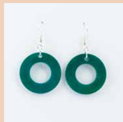
41269 Ohrring Tagua Kreis, türkis