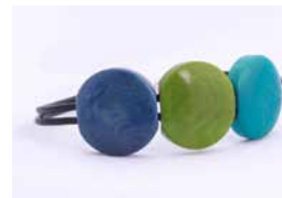
43134 Armband Tagua / 3 Kreise, sortiert