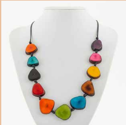
41181 Kette Tagua-Herz, multicolor

Modell Kette Tagua-Herz Material Tagua Nuss