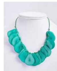
41322 Kette Tagua Chips, s.-grün