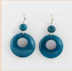
48459 Ohrr. Tagua Dora, petrol