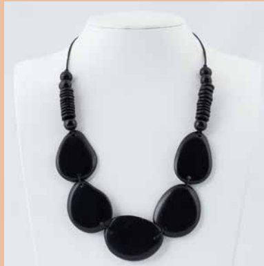
41243 Kette Tagua Dona, schwarz