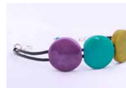
43134 Armband Tagua / 3 Kreise, sortiert