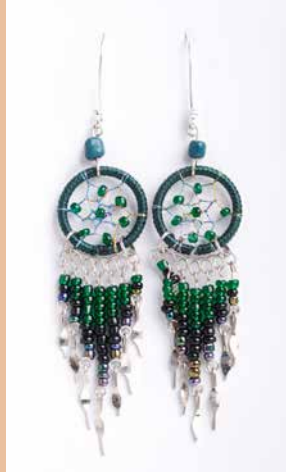
42989 Ohrh. Traumfänger, d.-grün