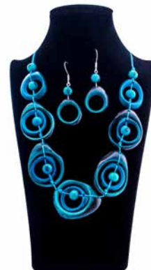
43138 Kette Tagua Lea, petrol 43135 Ohrh. Tagua, Dona, sort