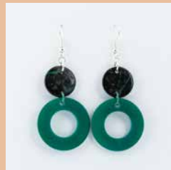
41275 Ohrring Tagua/Kokos Kreis, türkis