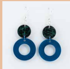
41276 Ohrring Tagua/Kokos Kreis, blau