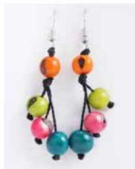
41356 Ohrh. Acai, 3-stufig, multicolor