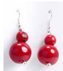
48465 Ohrh. Bombona, rot