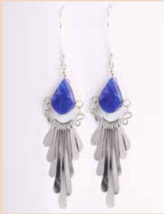
42993 Ohr. Kolibri, Sodalith