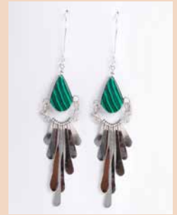
42997 Ohr. Kolibri, Malachit

Modell Ohrring Carmen Material Alpaka mit Silberverschluss