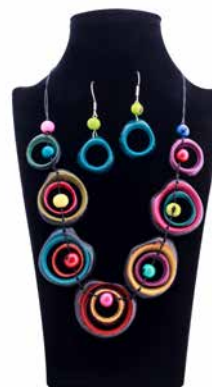
43137 Kette Tagua Lea, multicolor 43135 Ohrh. Tagua, Dona, sort