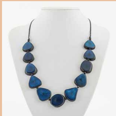
48646 Kette Tagua-Herz, blau