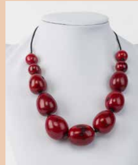
41230 Kette Aguaje, rot