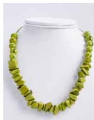
41326 Kette Tagua Kies, lemon