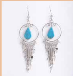
42998 Ohr. Carmen, türkis

Modell Ohrring Carmen Material Alpaka mit Silberverschluss