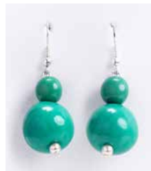
41335 Ohrh. Bombona, s.-grün