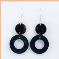
41271 Ohrring Tagua/Kokos Kreis, schwarz