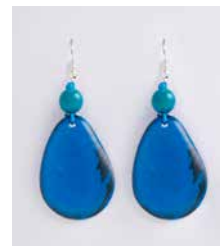
41347 Ohrh. Tagua/Acai, türkis