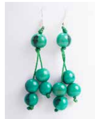
41340 Ohrh. Acai, s.-grün