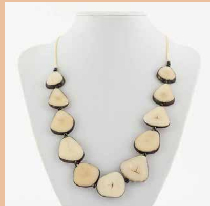
48647 Kette Tagua-Herz, natur