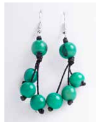
41359 Ohrh. Acai, 3-stufig, smaragdgrün