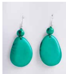
41349 Ohrh. Tagua/Acai, s.-grün