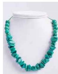
41327 Kette Tagua Kies,, s.-grün