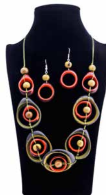
43139 Kette Tagua Lea, olive-orange 43135 Ohrh. Tagua, Dona, sort