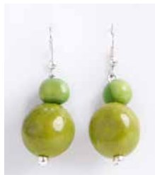
48464 Ohrh. Bombona, lemon