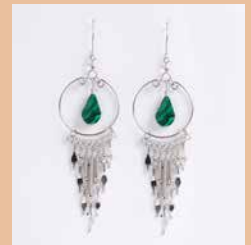
43003 Ohr. Carmen, Malachit