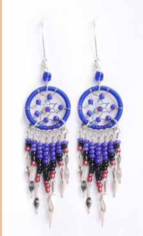
42987 Ohrh. Traumfänger, blau

Modell Ohrring Traumfänger Material Alpaka/Glasperlen mit Silberverschluss