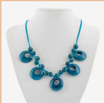
48453 Kette Tagua-Dora, petrol