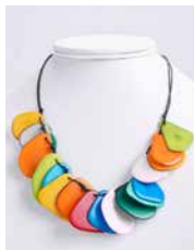
41324 Kette Tagua Chips, multicolor