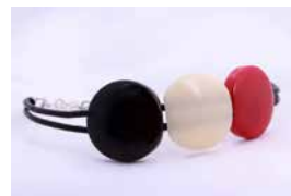
43134 Armband Tagua / 3 Kreise, sortiert