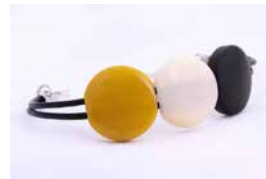
43134 Armband Tagua / 3 Kreise, sortiert