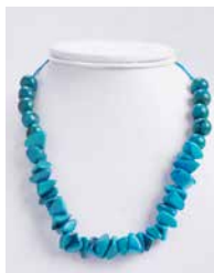
41325 Kette Tagua Kies, türkis