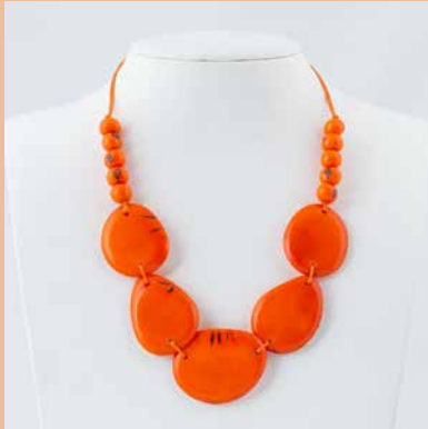
41238 Kette Tagua Dona, orange

Modell Kette Tagua Dona Material Tagua Samen