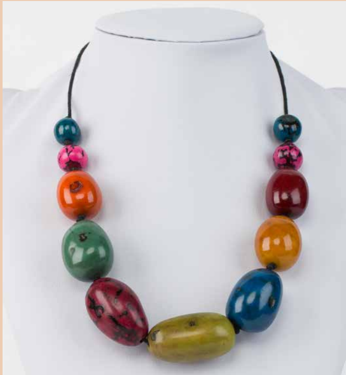
41229 Kette Aguaje, multicolor

Modell Kette Aguaje klassisch Material Aguaje Samen