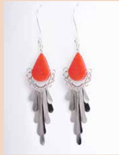
42995 Ohr. Kolibri, Jaspis