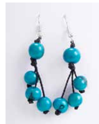
41357 Ohrh. Acai, 3-stufig, türkis