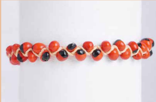
42984 Armband Huayruro, doppelt