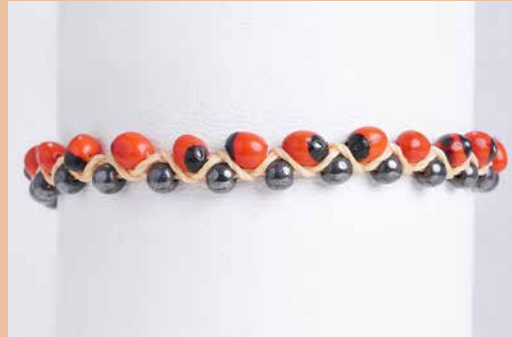
42986 Armband Huayruro mit Hämatit