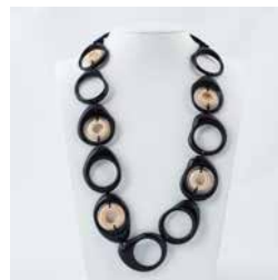
41313 Kette Tagua Olga, schw/weiß