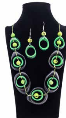
43140 Kette Tagua Lea, schw-grün 43135 Ohrh. Tagua, Dona, sort