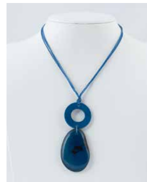
41282 Kette Tagua 1 Kreis/1 Tropfen, blau