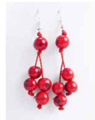
41341 Ohrh. Acai, rot