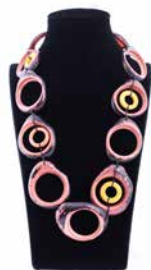
41319 Kette Tagua Olga, orange/w.T.