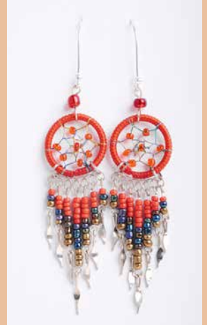
42991 Ohrh. Traumfänger, rot