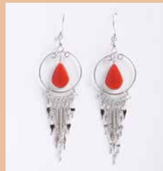
43001 Ohr. Carmen, Jaspis