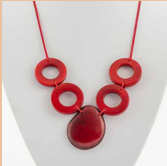
41284 Kette Tagua 4 Kreise/1 Tropfen, rot

Modell Kette 4 Kreise/1 Tropfen Material Tagua Nuss