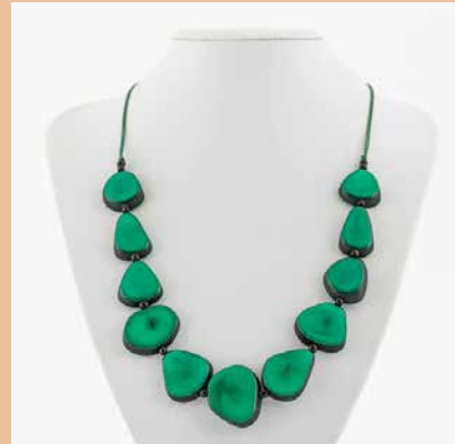
41311 Kette Tagua-Herz, türkis