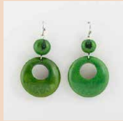
48460 Ohrr. Tagua Dora, lemon