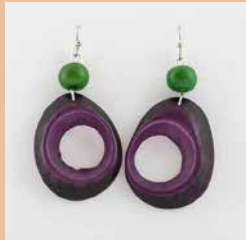
43135 Ohrrh. Tagua, Dona, sort.