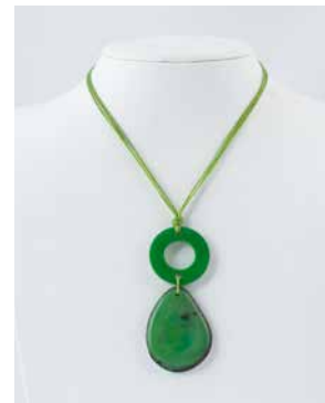
41280 Kette Tagua 1 Kreis/1 Tropfen, lemon