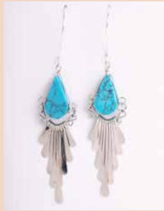
42992 Ohr. Kolibri, türkis

Modell Ohrring Kolibri Material Alpaka mit Silberverschluss