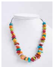
41329 Kette Tagua Kies, multicolor