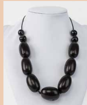
41236 Kette Aguaje, schwarz