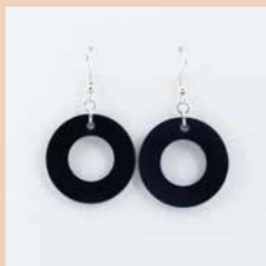
41265 Ohrr. Tagua Kreis, schwarz