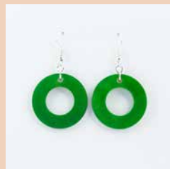
41268 Ohrring Tagua Kreis, lemon – grün