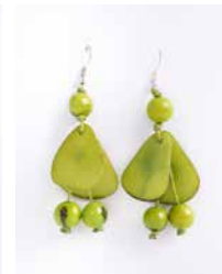
41343 Ohrh. Tagua Chips, lemon