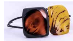
43133 Armband Tagua / 2 Quadrate, sortiert