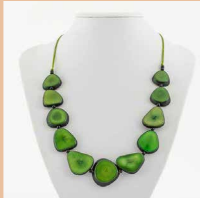
41310 Kette Tagua-Herz, lemon