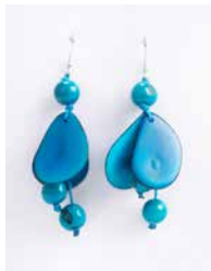
41342 Ohrh. Tagua Chips, türkis