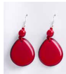
41350 Ohrh. Tagua/Acai, rot