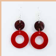
41272 Ohrring Tagua/Kokos Kreis, rot