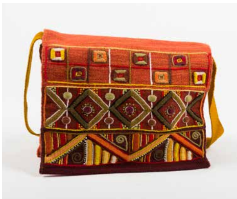
80020 Umh-Tasche, Geom Nr. 1, warme Farben 80021 Umh-Tasche, Geom Nr. 1, blaue Farben