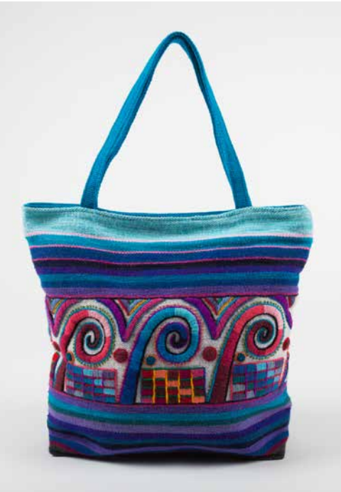
80030 Hand-Tasche, Geometrische Welle, blaue Farben