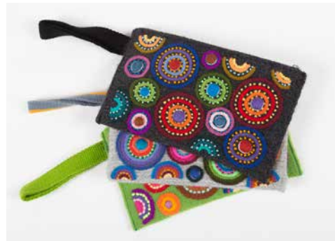
80001 Börse Kreise, d.grau, SW 80002 Börse Kreise, h.grau, SW 80003 Börse Kreise, lemon-grün, SW 80004 Börse Kreise, royal blau, SW 80005 Börse Kreise, rot, SW