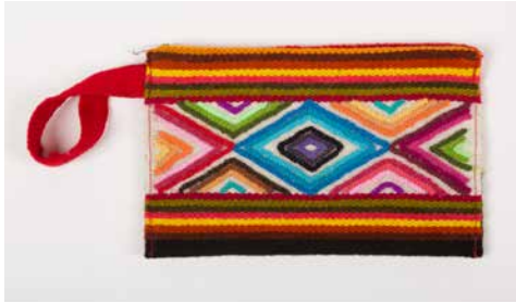
80010 Börse Geom. Nr. 1, multicolor, SW