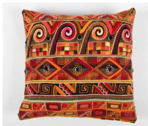
80035 Polster Huari, warme Farben