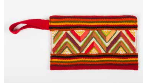
80014 Börse Geom. Nr. 3, warme Farb. 80015 Börse Geom. Nr. 3, blaue Farb.