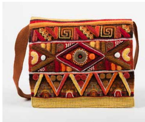
80022 Umh-Tasche, Geom Nr. 2, warme Farben 80023 Umh-Tasche, Geom Nr. 2, blaue Farben