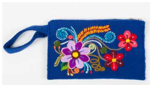
80008 Börse Blume Mod. 2, blau, SW 80009 Börse Blume Mod. 2, h.grau, SW