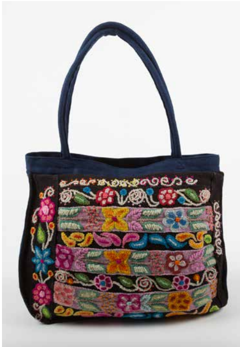
80033 Tasche Shopper, Blumen-Motiv Nr. 2