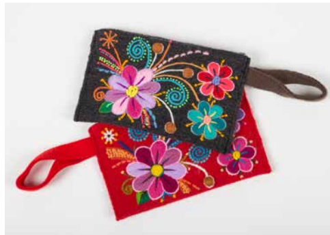
80006 Börse Blume Mod. 1, d.grau, SW 80007 Börse Blume Mod. 1, rot, SW