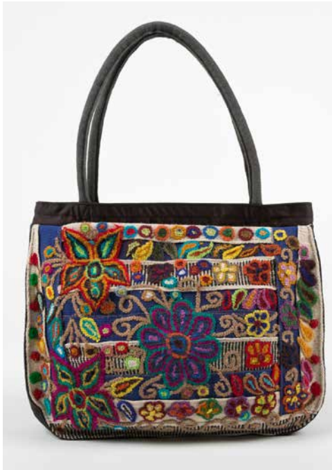
80032 Tasche Shopper, Blumen-Motiv Nr. 1