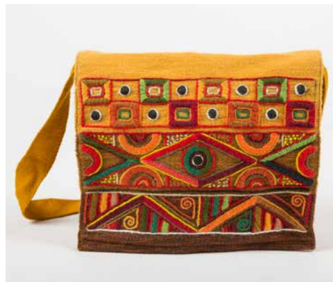
80024 Umh-Tasche, Geom Nr. 3, warme Farben 80025 Umh-Tasche, Geom Nr. 3, blaue Farben