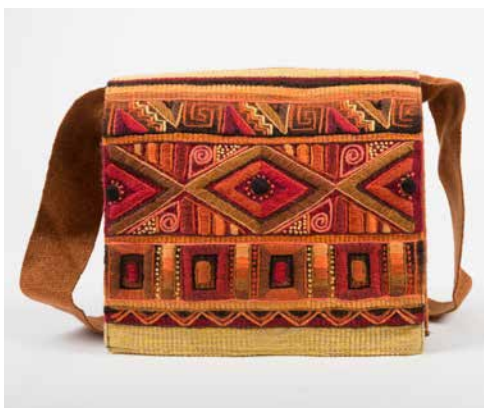
80028 Umh-Tasche, Geom.Nr. 5, warme Farben 80029 Umh-Tasche, Geom.Nr. 5, blaue Farben