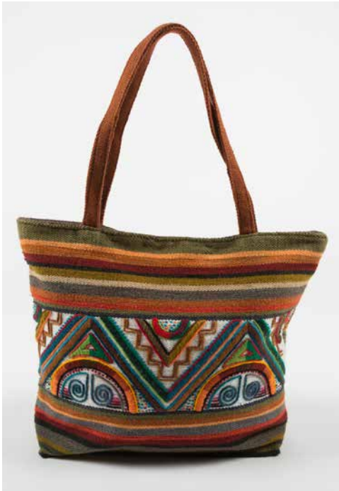
80031 Hand-Tasche, Geometrisch Nr. 1