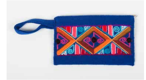
80016 Börse Geom. Nr. 4, warme Farb. 80017 Börse Geom. Nr. 4, blaue Farb.