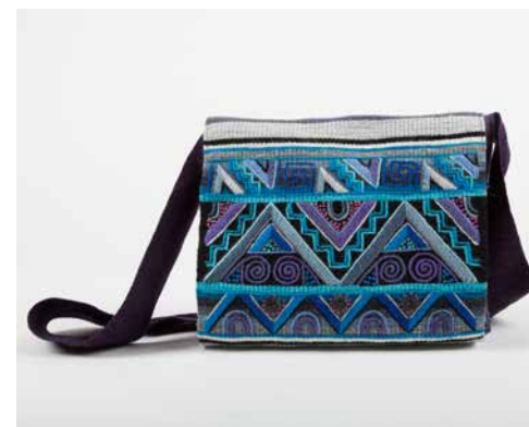
80026 Umh-Tasche, Geom Nr. 4, warme Farben 80027 Umh-Tasche, Geom Nr. 4, blaue Farben