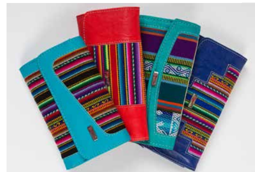
80054 Geldtasche, Manta, mittel, sort. Innenleben aus Kunststoff 80055 Geldtasche, Manta, groß, blau 80056 Geldtasche, Manta, groß, türkis 80057 Geldtasche, Manta, groß, rot 80058 Geldtasche, Manta, mittel, türkis