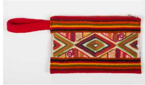
80012 Börse Geom. Nr. 2, warme Farb. 80013 Börse Geom. Nr. 2, blaue Farb.