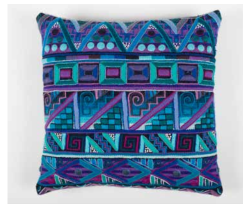
80036 Polster Huari, blaue Farben